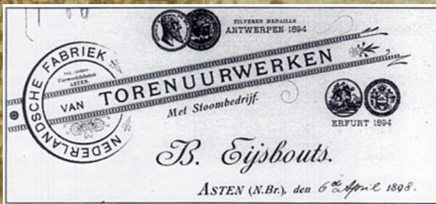
Titelblad van die katalogus van 1908 Bonaventura Eijsbouts